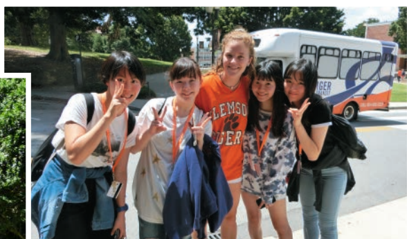
高大連携協定を結んでいる電通大の留学生を招いてのDLP異文化理解講座